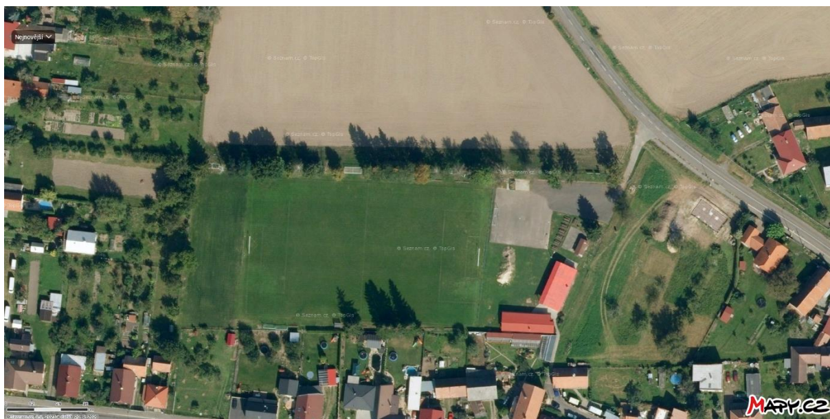
Obr. 3 Letecký pohled na areál TJ Orel

Veškerá uvedená infrastruktura je v majetku TJ Orel, z. s.