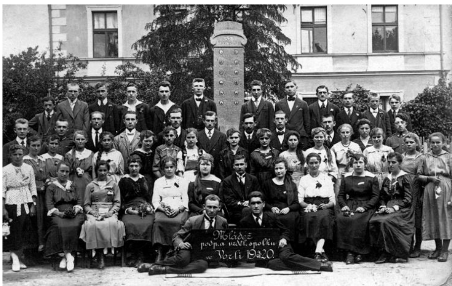
Mládež podpůrného a vzdělávacího spolku ve Vorkli, 4. 7. 1920.

Spolek, v září 1920 přejmenovaný na Podpůrný a vzdělávací spolek Karel Havlíček Borovský v Orli, pokračoval v činnosti až do nacistické okupace v roce 1939. Pořádal slavnosti, plesy, finančně podporoval chudé děti, vdovy, sirotky a další potřebné. V polovině třicátých let sdružoval okolo stovky členů.